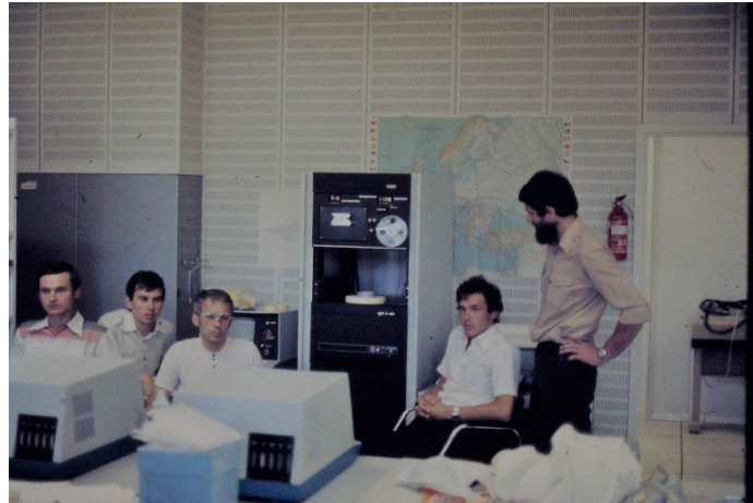
Sála výpočtového strediska OSN Laxemburg pri Viedni so SMEP-om SM 4-20

miestnosti, kde sme si mohli dať kávu, čaj a horúcu čokoládu. Nakoniec nás pozval na uvítací obed do ich jedálne. Prekvapilo nás menu s množstvom ponúkaných jedál a aj minútkami, ktoré pripravovali priamo pred stravníkmi.