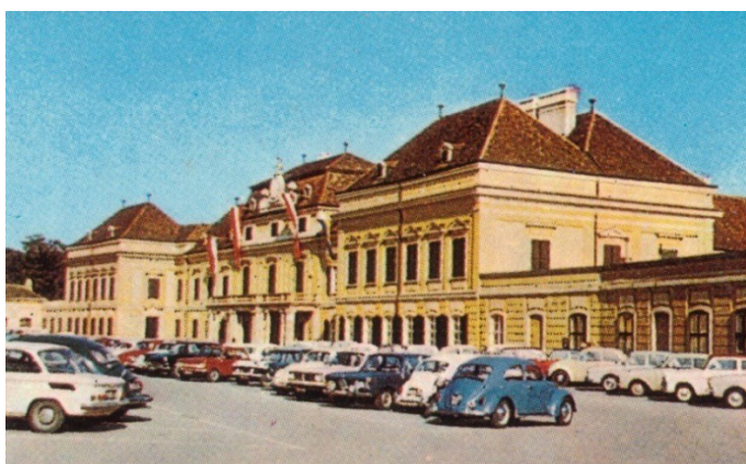
Výpočtove stredisko OSN Laxemburg pri Viedni v novom zámku